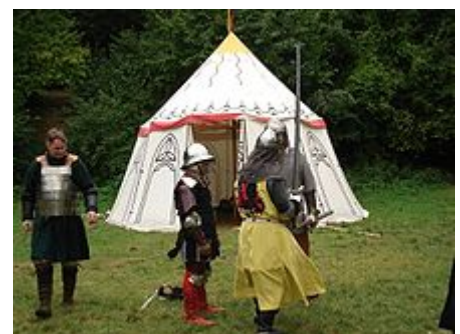
Eine Szene eines „Pas d'armes“ Turniers in Deutschland

Die SCA besteht aus vielen lokalen Gruppen, die sich teilweise wöchentlich treffen. Bei verschiedenen Veranstaltungen tragen Mitglieder der SCA mittelalterliche Kleidung, tanzen historische Tänze und essen mittelalterliche Gerichte. Bei größeren Veranstaltungen gibt es auch Turniere, Ausstellungen, Wettkämpfe, Vorträge über mittelalterliche Künste, Workshops und oft ein abendliches Festmahl, königliche Hofhaltungen sowie Tänze und Musik. In der Regel sind größere SCA-Veranstaltungen nicht öffentlich zugänglich und bedürfen vorheriger Anmeldung der Teilnehmer.