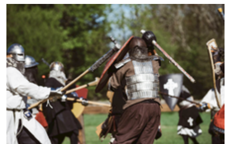
SCA-Mitglieder kämpfen in einer Schlacht in Schweden

Der Schwertkampf der SCA basiert auf dem Fußkampf bewaffneter Ritter, wie er z. B. im mittelalterlichen Kolbenturnier stattfand und folgt einem eigenen Regelwerk [6] . Es gibt ihn als Duell oder als Gruppenkampf. Der Kämpfer selbst entscheidet, ob ihn der Schlag, den er erhalten hat, im Ernstfall verwundet oder getötet hätte. Wenn dieser einen Schlag als zu leicht empfunden hat, geht der Kampf weiter. Um Verletzungen zu vermeiden, wird in richtigen Rüstungen aus Metall, Leder, Stoff und mit Rattanwaffen, gekämpft. Rattan ist ein tropisches Gras, aus der z. B. Möbel gemacht werden. Es entspricht im Gewicht und Schlagverhalten den mittelalterlichen Waffen. Elastisch wie Bambus, hat es aber keinen hohlen Kern, splittert deswegen weniger leicht und nimmt einen Teil der Wucht aus dem Schlag. Die Oberfläche wird zusätzlich durch eine Schicht Textilklebeband geschützt und von der Farbe her Metall angeglichen. Die wesentlichen Körperteile wie Kopf, Nacken, Wirbelsäule, Ellbogen, Knie, Nieren, Hände und Genitalien müssen dabei durch genau festgelegte Rüstung geschützt werden. Die meisten Kämpfer entscheiden sich jedoch freiwillig mehr Rüstung zu tragen, um auch den Torso, die Arme und die Beine zu schützen.