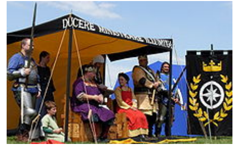
Nachgestellte Hofszene bei einem öffentlichen Event der SCA

Die SCA wurde 1966 als nonprofit corporation SCA, Inc. in den USA von einer Gruppe Mittelalterbegeisterter gegründet. Gründungsmitglieder waren unter anderem die Autorinnen Marion Zimmer Bradley und Diana L. Paxson. Mit der Gründung der Gesellschaft für lebendige Geschichte e.V. und einem mit der SCA, Inc. abgeschlossenen Affiliierungs-Vertrages, existiert seit 2019 eine rechtlich selbstständige SCA-Organisation in Deutschland. [3]