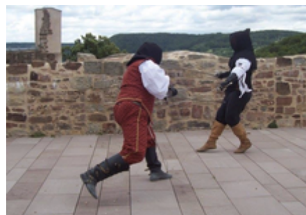
Fechten mit dem Rapier während eines SCA-Events in Deutschland.

Zu den weiteren Formen des Kampfes zählen auch das Bogenschießen, Fechten mit Stahlschwertern sowie die Verwendung von Wurfaffen und Belagerungsgeräten.